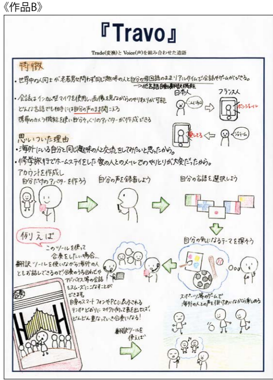
近年、ソフトウェアの翻訳機能が目覚ましい発展を遂げていることを考えると、遠くない将来このような翻訳アプリが現実的になる可能性もあるでしょうね。合奏の際のコミュニケーションツールや、共通の趣味のユーザーを見つけるための媒体としての提案も面白いです。