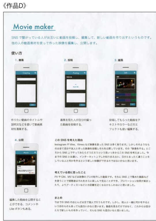
動画をユーザー同士が編集しあって新しい動画を作り出すという協力的な創作のアイデアですね。動画の編集は一般的には難易度が高いものですが、その動画編集をアプリを使って簡単に行い共有するというのが現代的な発想だと思います。また、企画案が非常に綺麗にまとめられているため、読む側にとって好印象です。