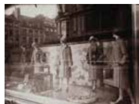
ウジェーヌ・アジエ ボン・マルシェのデパート 制作:1926年